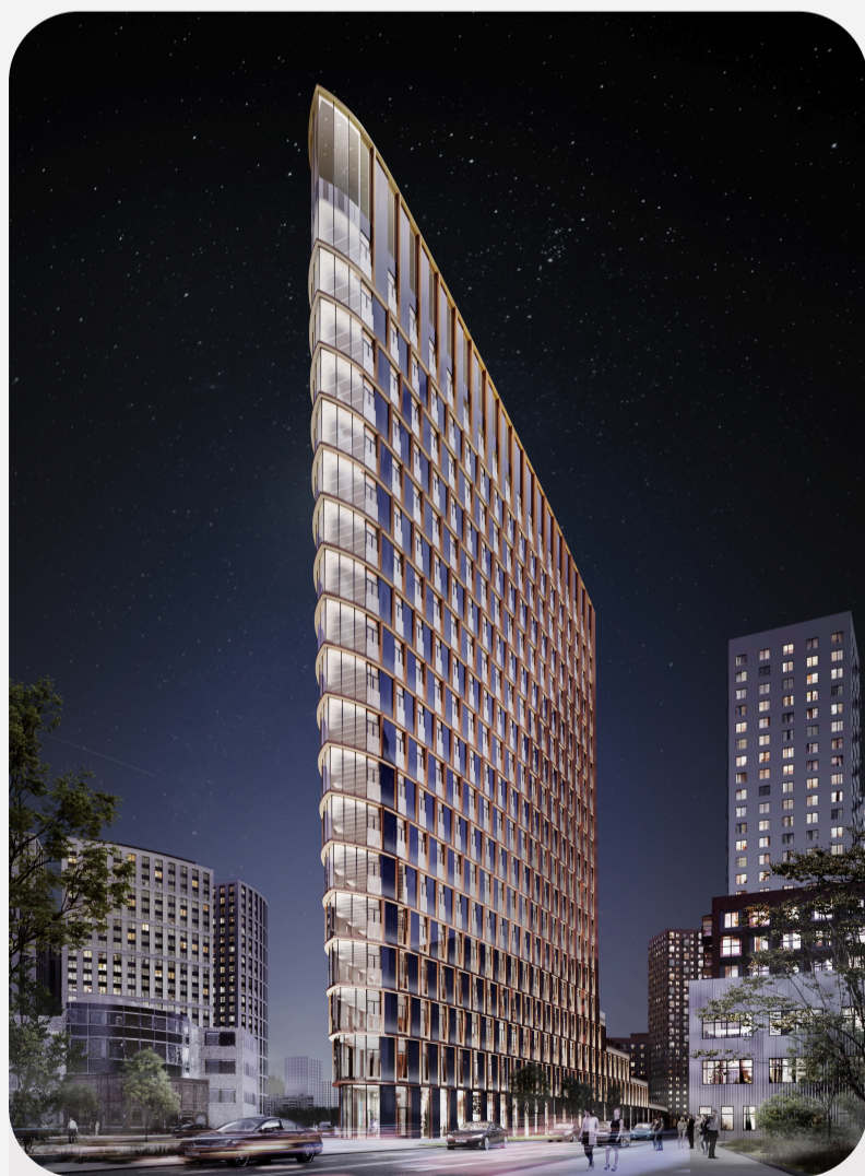
Офисы класса А и В+