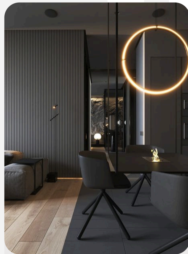
Жилье премиум и бизнес-класса