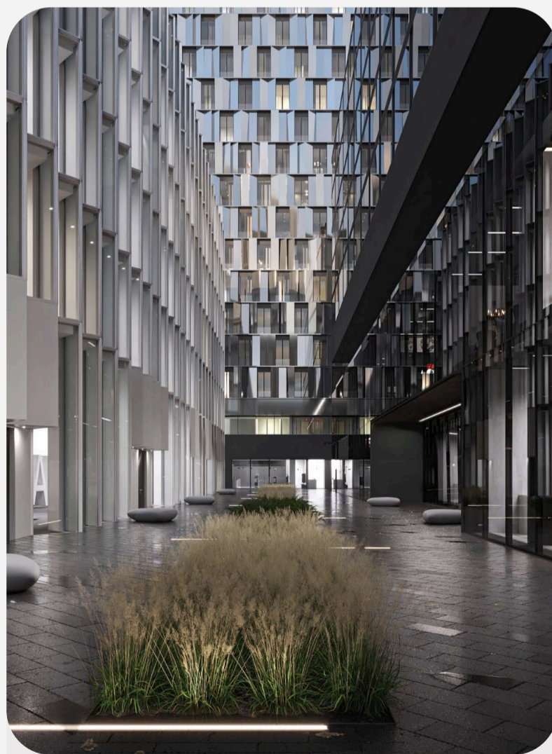
Ритейл на трафике